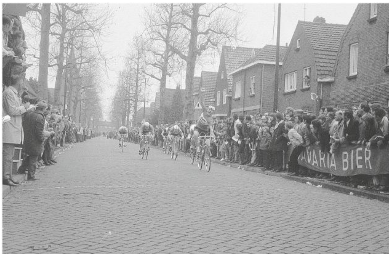
Fons van Katwijk wint de ronde van Helmond in 1972