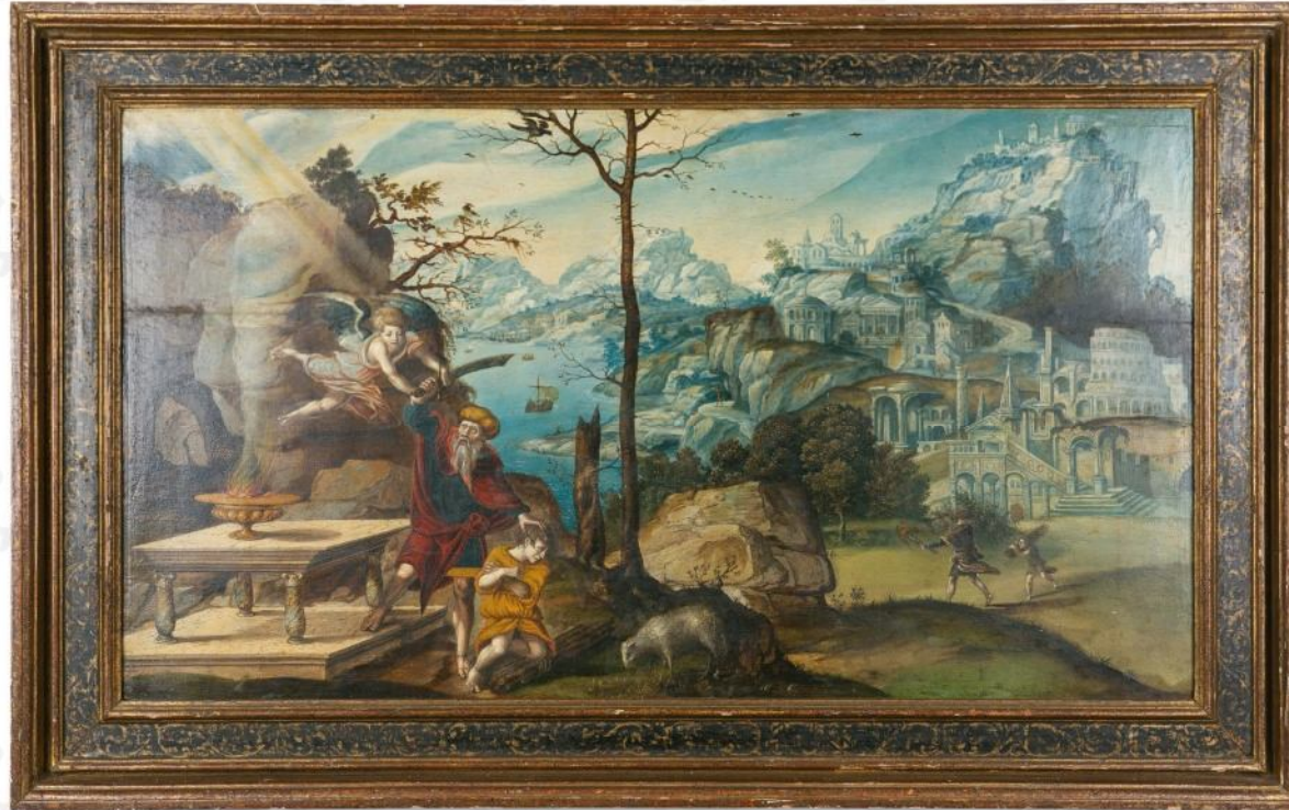
Het offer van Abraham , afmeting: 90 x 85 cm, geïsoleerd LG en gelatodeerd 1540, particuliere collectie in België

In het landschap neemt de rivier een bijzondere plek in. Op de achtersteven van de boot staat de schipper met het roer in de hand. 'Hoe moet hij varen?' Gelukkig, hij wordt geholpen. Op de rotover staat iemand met een spiegel die hem als een soort koolde weg wijst (3). Heel speciaal dat dit vernieuwde tafereel in 1540 door Gassel is weergegeven. Maar wat zegt het paneel nog meer? In de Bijbelse tijd kon je rekenen op Gods voorzienigheid en in de moderne tijd op het menselijk verstand. Het humanisme breekt door, ook in Gassels werken.