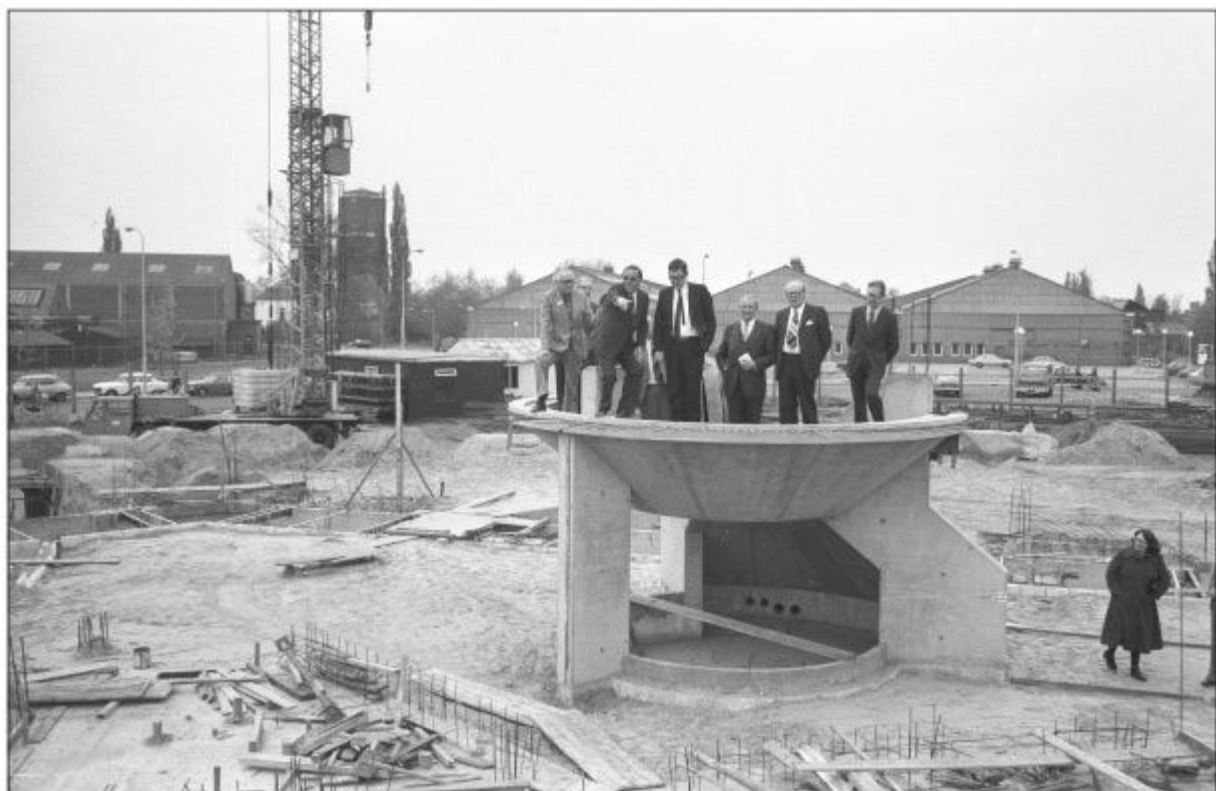
Minister Gruijters bezoekt de bouw op 1 mei 1976. Het gezelschap staat op de toekomstige trapopgang met daaronder de zitkuil.