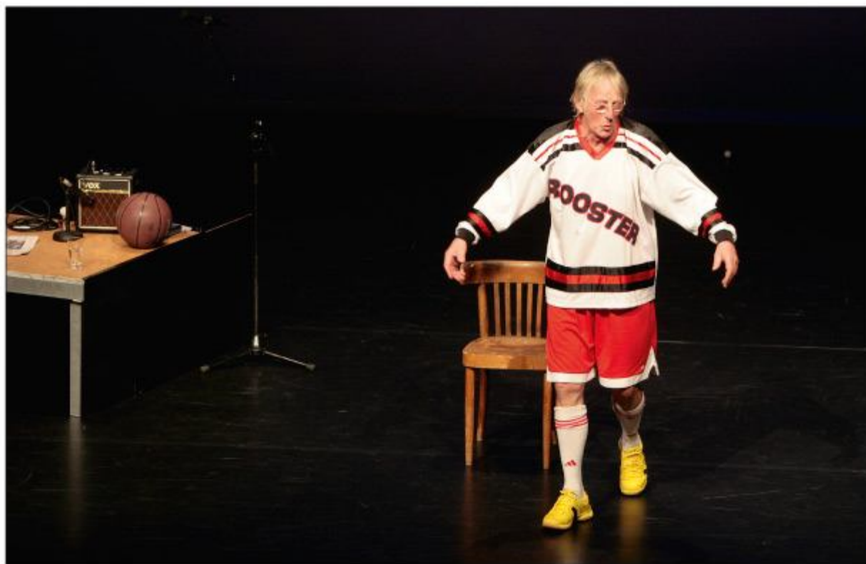
Optreden van Freek de Jonge op 28 november 2008. Freek was, samen met vele andere nationale en internationale coryfeeën, een graag geziene gast in 't Speelhuis.