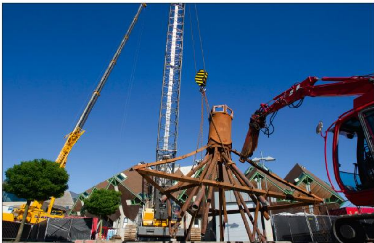
De sloop is begonnen. Op 25 mei 2012 werd als een van de eerste werkzaamheden de top met de uivormige piek naar beneden gehaald.