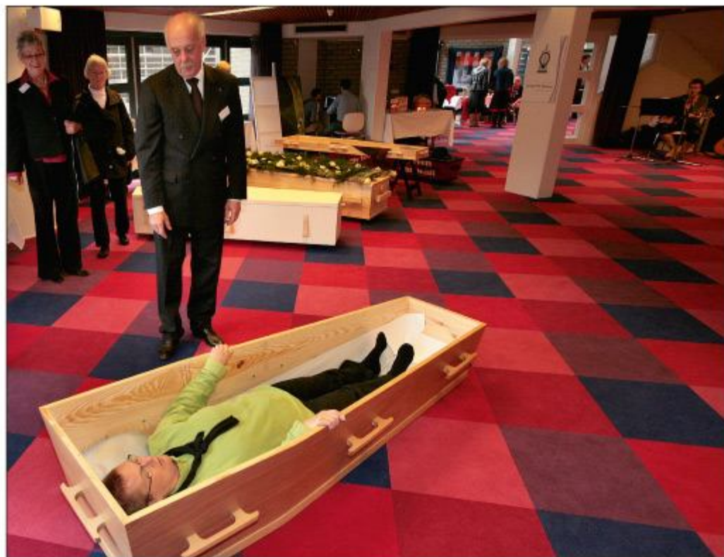
Demonstratie/expositie van doodslisten in de foyer, op 24 oktober 2009.