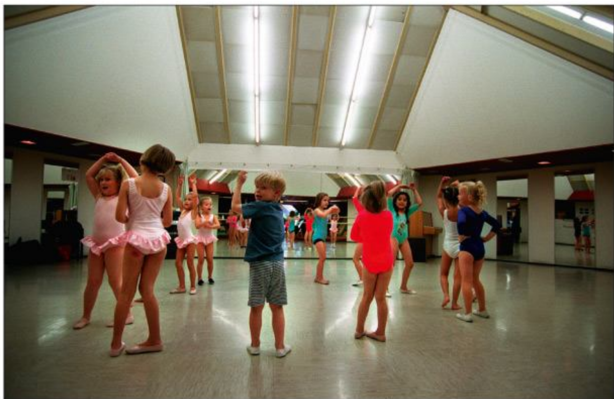
't Speelhuis bood ook onderdak aan alle vormen van creativiteitsontwikkeling (GIKO). In de bovenbouw waren aparte zaaltjes. De foto (13 juli 1998) toont dansvorming van kinderen.