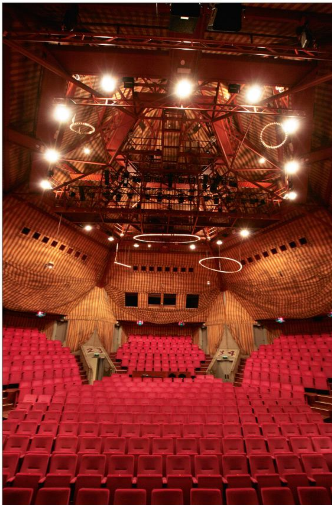
Sfeerimpressie van de zaal, na de verbouwing in 2003, met onder andere nieuwe stoelen.