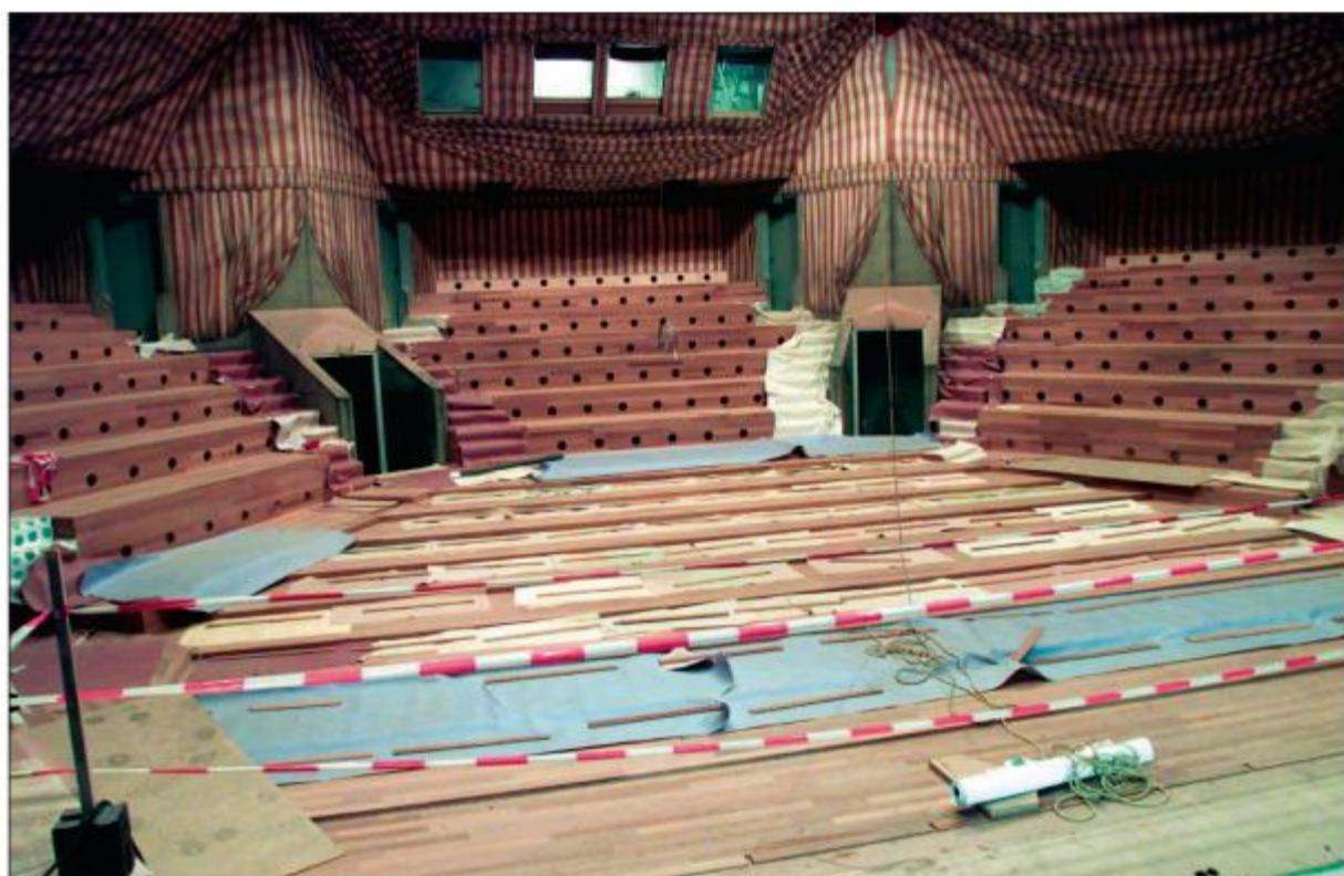
Verbouwing op 14 november 2002. "En ronde" verdwijnt voor een vaste vloer met vaste stoelen. Gelijkijdig werd onder andere ook de lichtbehandeling verbeterd.