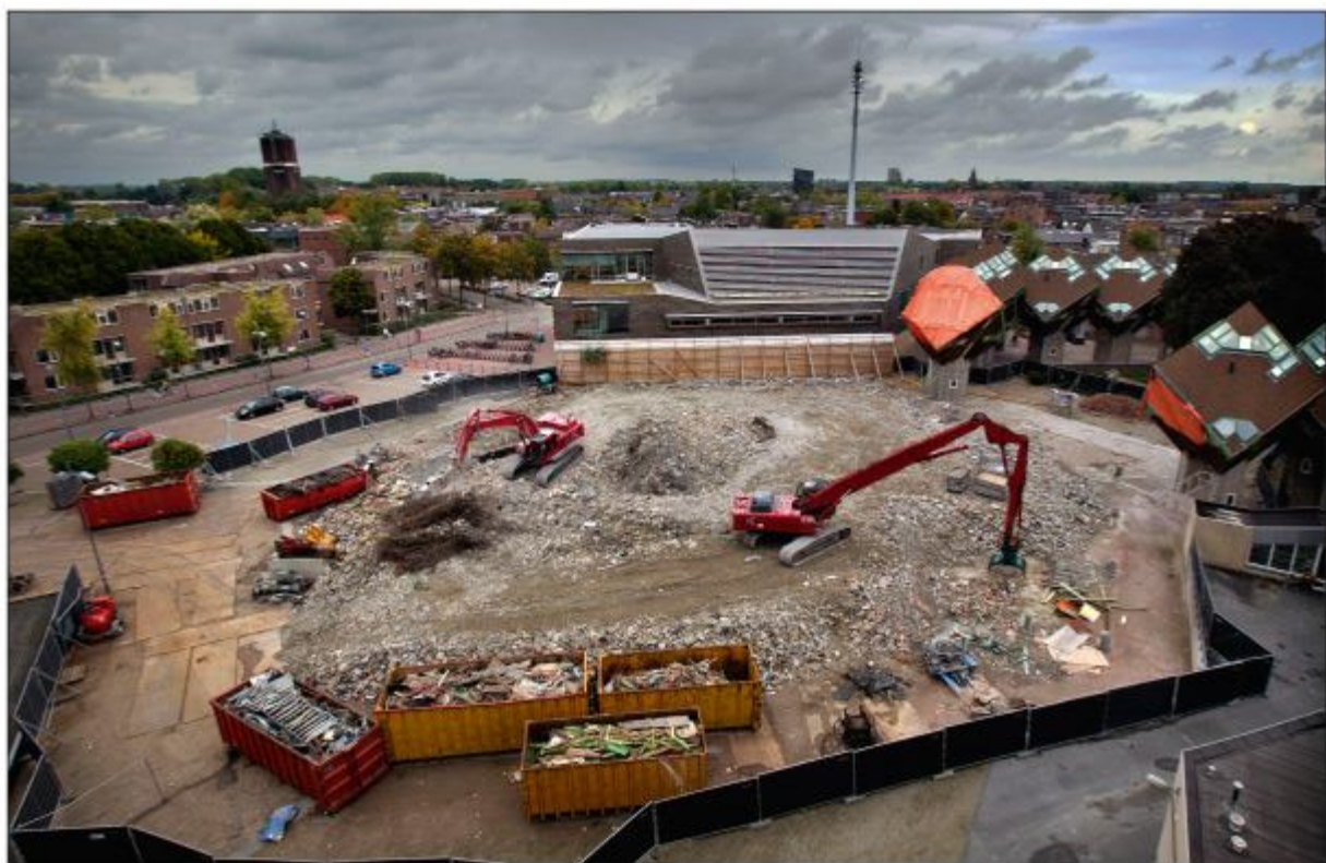
Alles ligt plat op 3 oktober 2012.