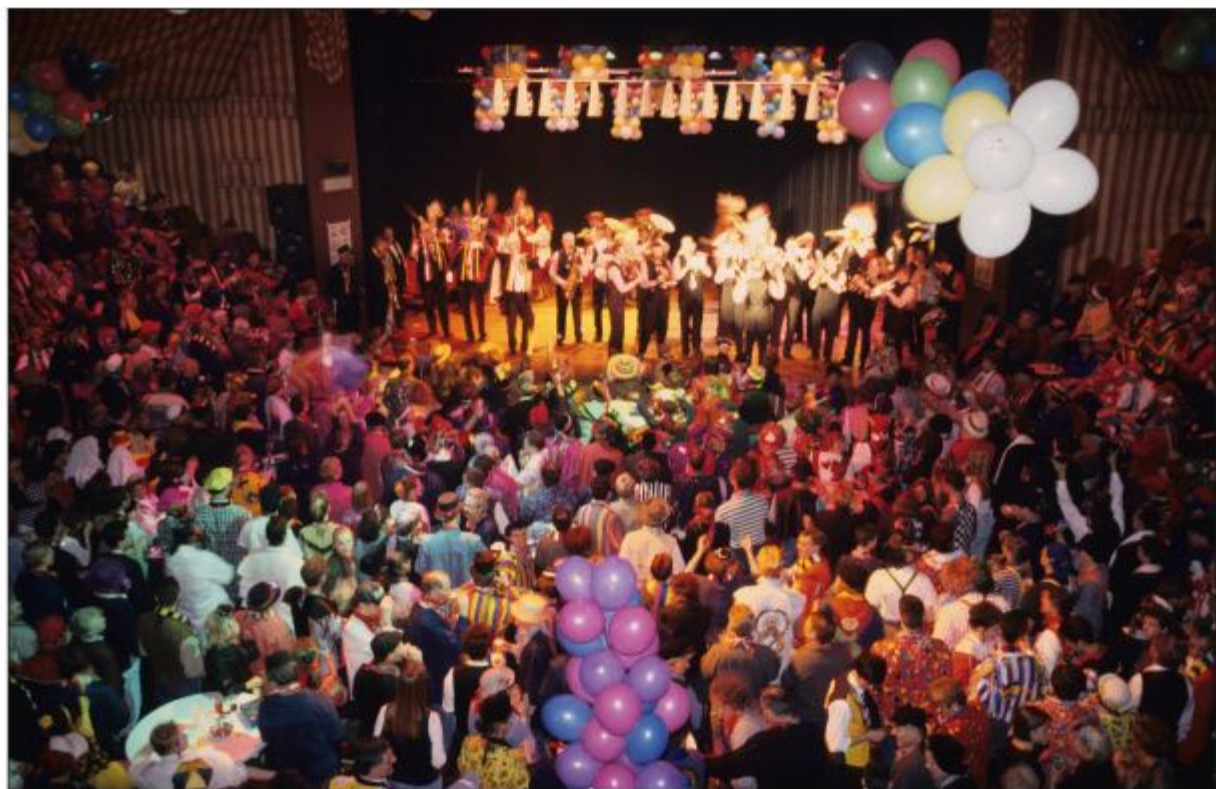
Ook het Prijsbloaze op carnavalsmaandag was jarenlang een orwergetelijke happening, zoals hier op 14 februari 1994. De brandweer kniep toen nog een oogje dicht!