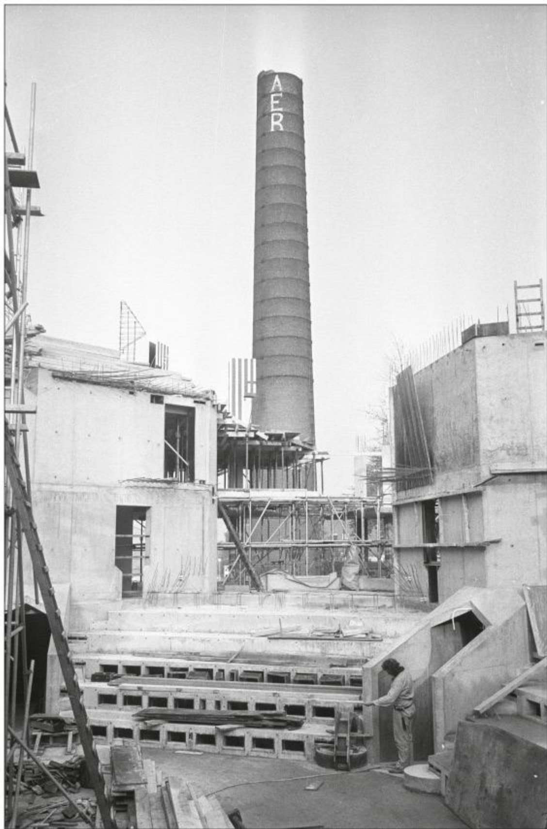
Bouw op 26 oktober 1976, met op achtergrond de schoorsteen van de voormalige fabriek Ramaer aan de Watermolenwal.