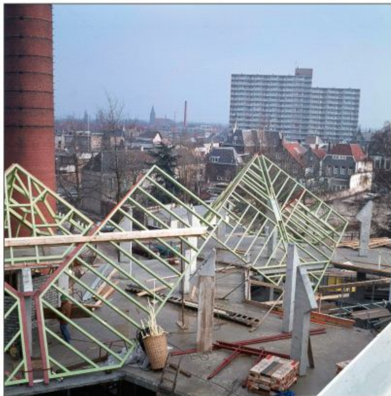
Panorama met Binnenstad-Oost op de achtergrond, 10 november 1976.