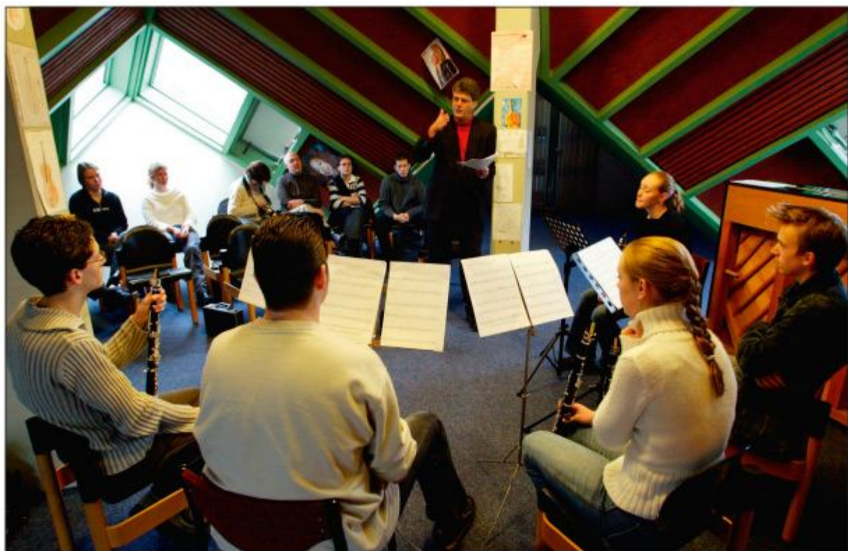
Workshop klassieke muziek onder het schuine dak, op 26 februari 2004.