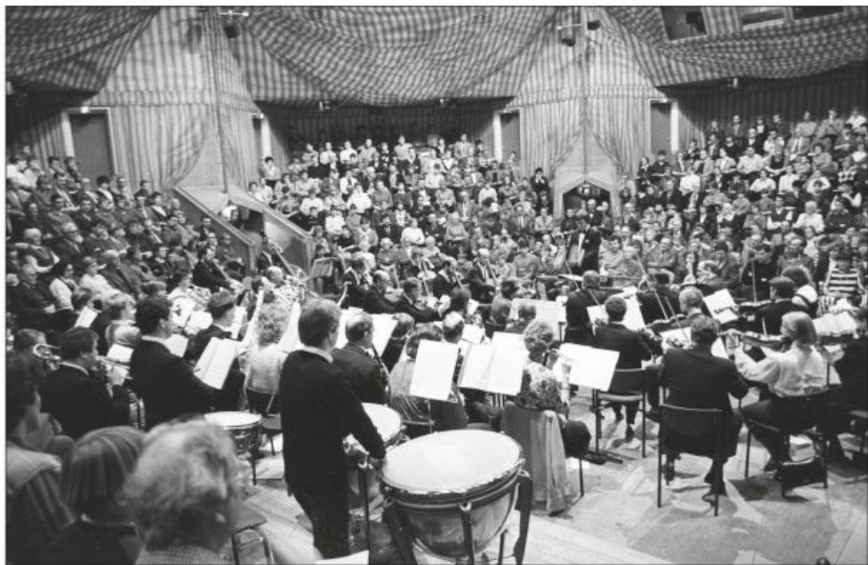
Concert "en ronde" van de Helmondse Orkest Vereniging (HOV) op 26 december 1985.