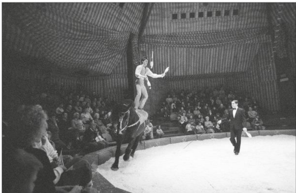
Jongleren op een rijdend paard in een echte circuspiste. Dat gebeurde tijdens het Wintercircus op 7 januari 1989.