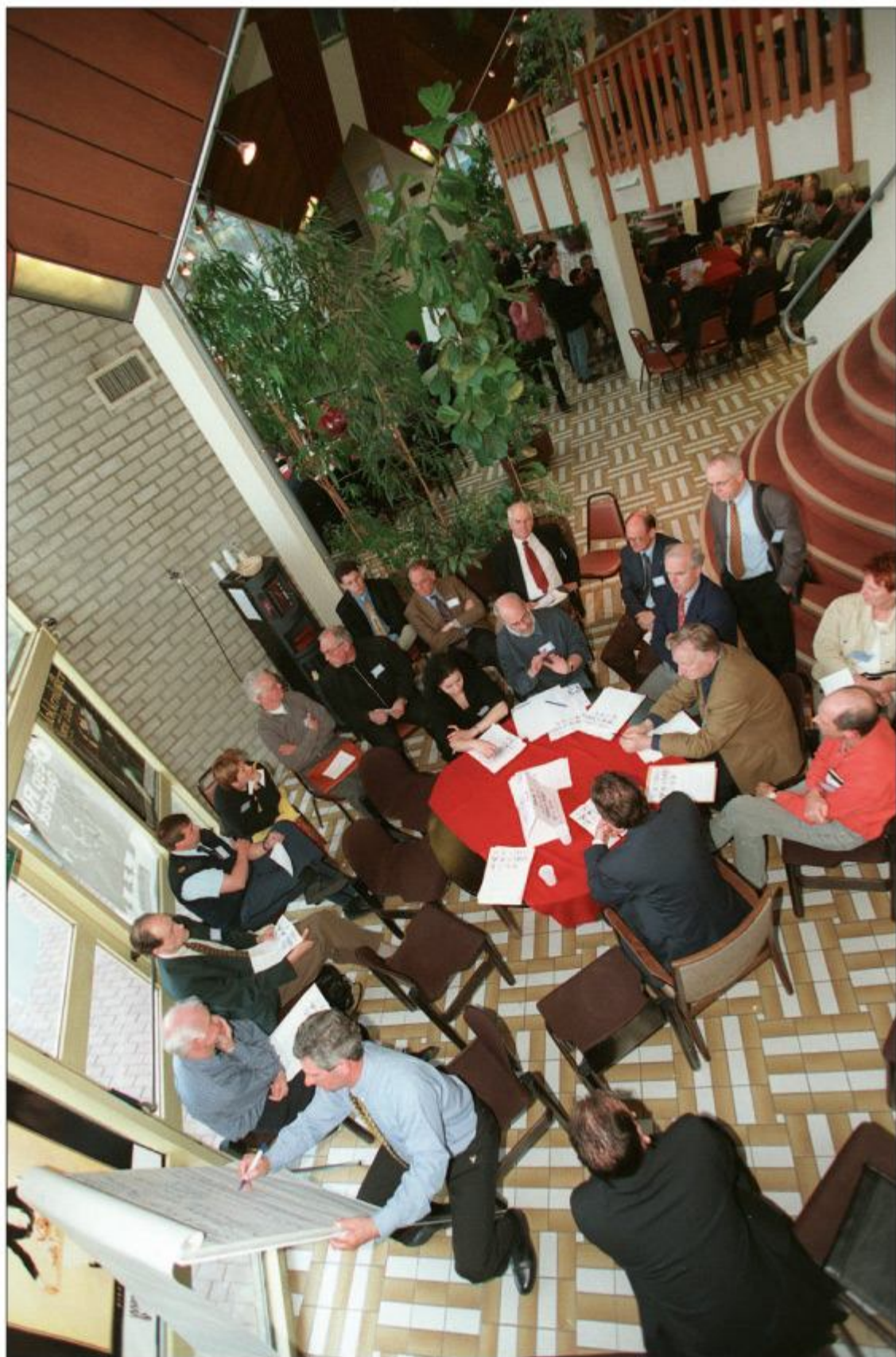
't Speelhuis fungeerde ook vaak als vergader- of congreslocatie. De foto toont een gespreksgroep in de foyer op 30 maart 1999. De gemeente organiseerde een inspraakbijeenkomst over Helmond na 2000. Herkent u de deelnemers?