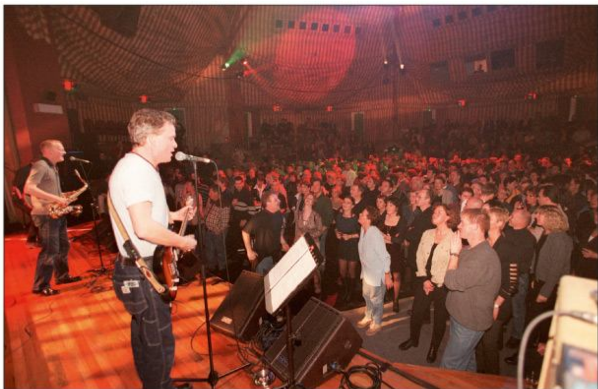
De bals van de Zestiger Jaren Pop in 't Speelhuis waren berucht. Stoelen eruit en swingen maar, zoals hier op de foto van 12 december 1998.