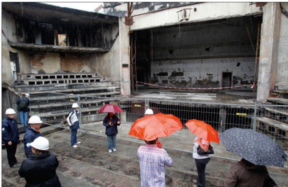
Nog een laatste afscheid tijdens de open dag op 26 augustus 2012.