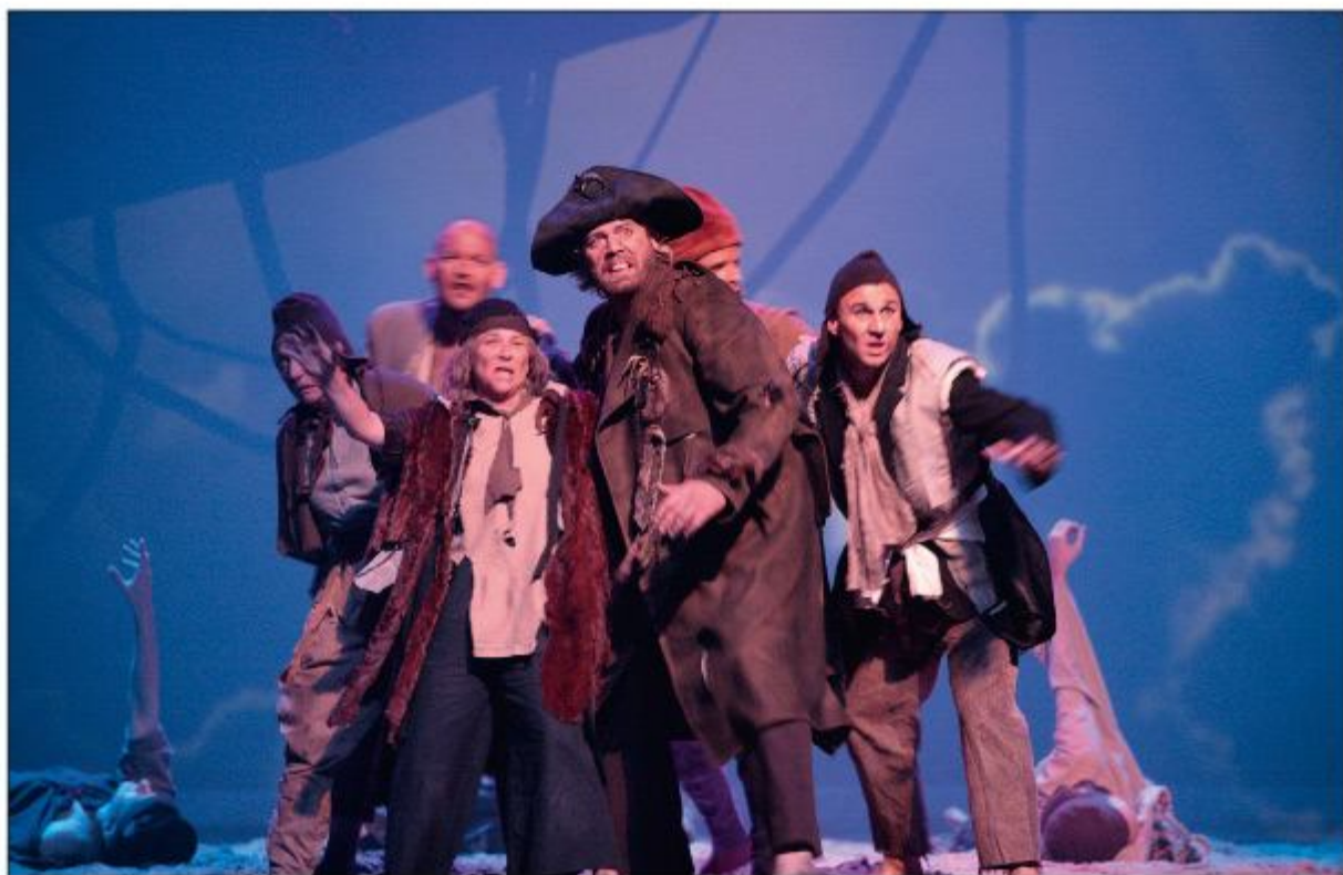
Toneelgroep Genesisius uit Helmond voerde jaarlijks een of meerdere toneelstukken op, voor volle zalen, zoals hier op 5 november 2009.