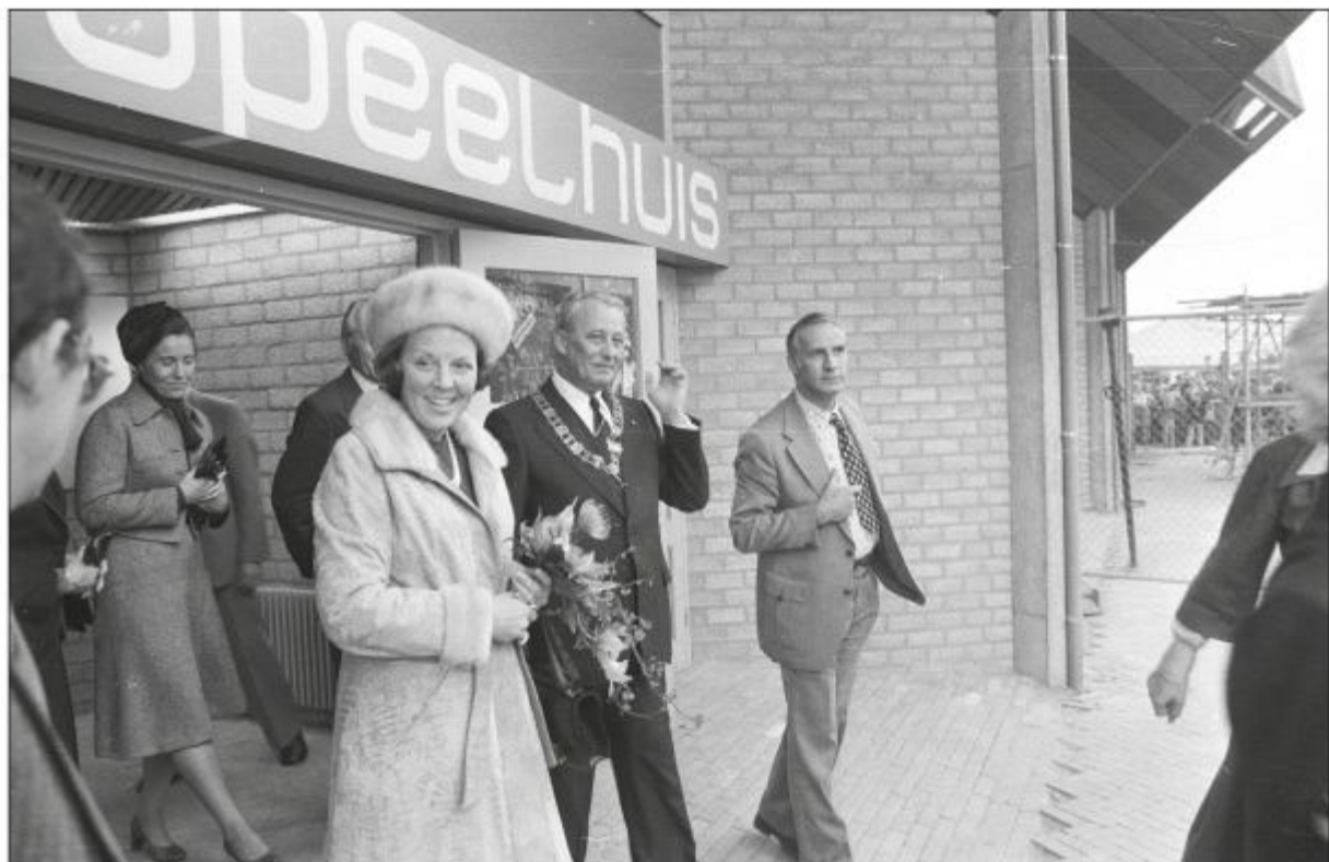
Prinses Beatrix verlaat 't Speelhuis na de opening op 28 oktober 1977.