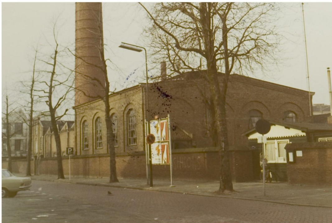
W. G. J. Ramaer en Co.