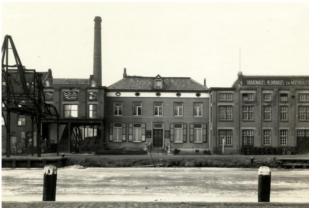
Gebr. van Thiel/Robur