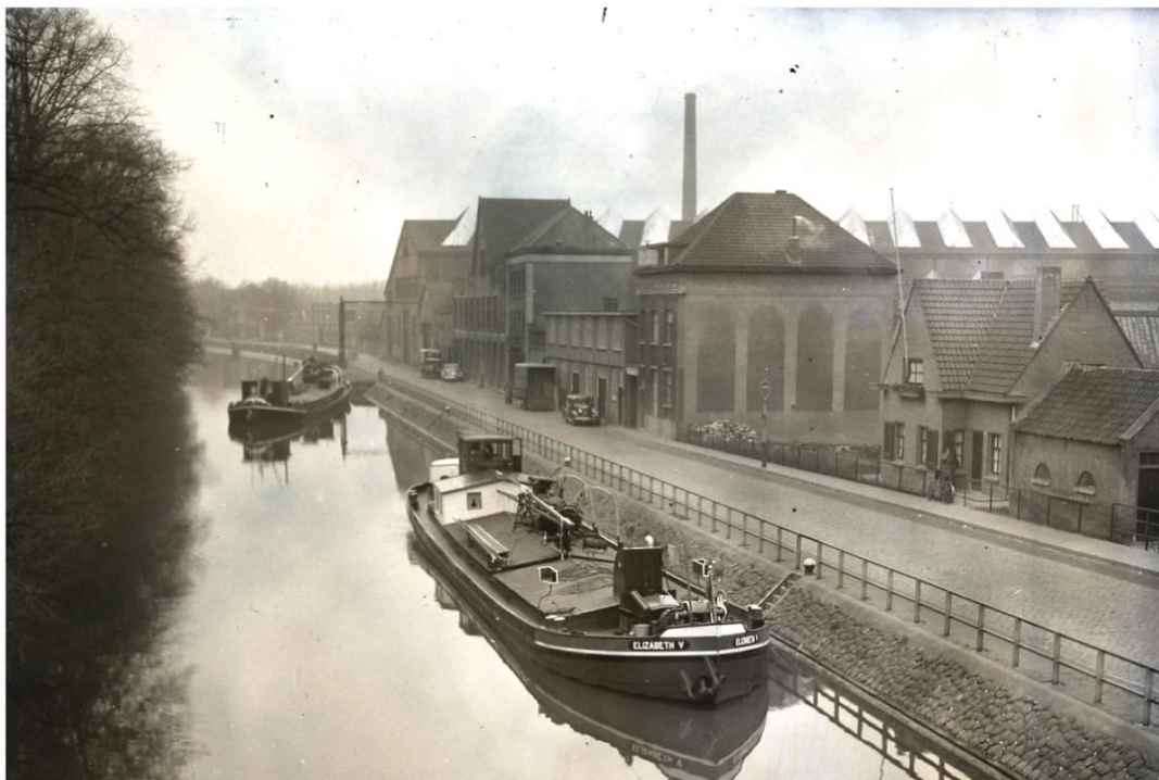
Begemann/Koninklijke Nederlandse machinefabriek v/h EH Begemann